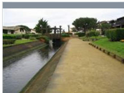
A Vieux Boucau, circuit du Lac Marin