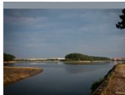
Lac marin de Port d'Albret